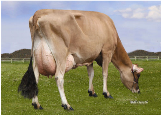
LUCKY HILL JOKER WABORITA FOURTH DAM