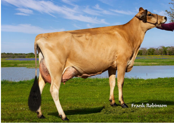
JX LUCKY HILL WILDFLOWER {6} GRANDDAM

JOHNNYCASH-P x JX CLEARCUT{3} x BALTAZAR {5}